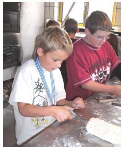
Formen der Brote...