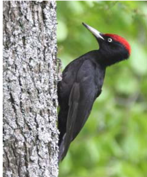
Schwarzspecht – Vogel des Jahres